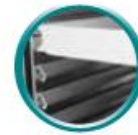
bacs à pâtons (non fourni)