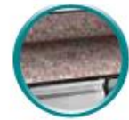
plan de travail granit